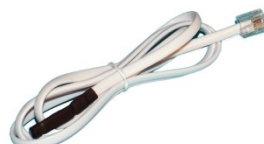
Temp-1Wire 1m 600 242