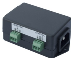
PowerEgg 600 237