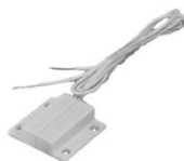
Door Contact 600 119