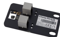
HTemp-Rack19 600 330